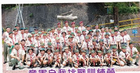
童軍自我挑戰訓練營