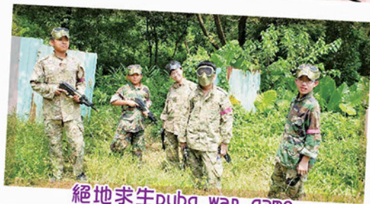
絕地求生pubg war game