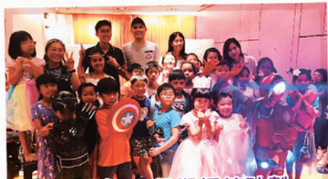
童玩童FUN暑期托管計劃 結業禮