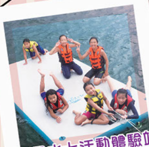
親子水上活動體驗站