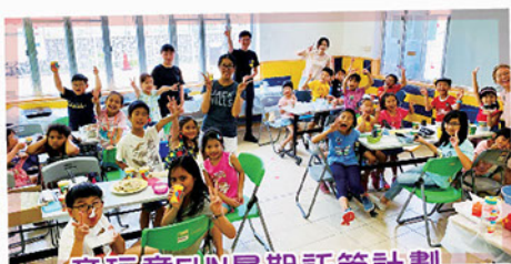
童玩童FUN暑期託管計劃