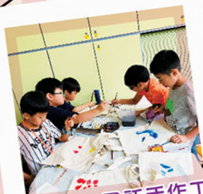
童玩童FUN暑託手工坊