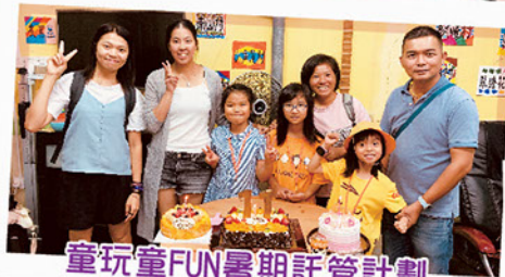
童玩童FUN暑期託管計劃