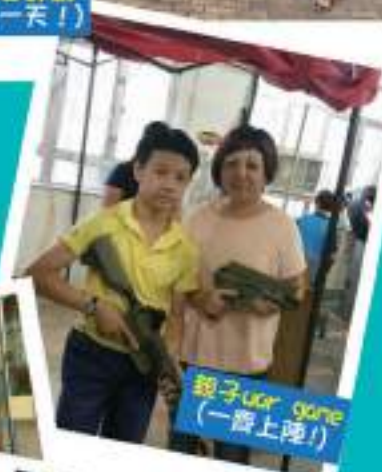
親子uor game (一齊上陣！)