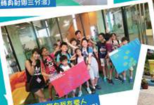
SUPER挑戰自我友家人 (喂喂良心手執唔係牛角噏)