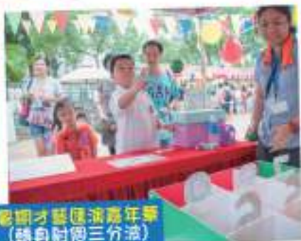
暑期才藝匯演嘉年華 (聽身耐細三分波)