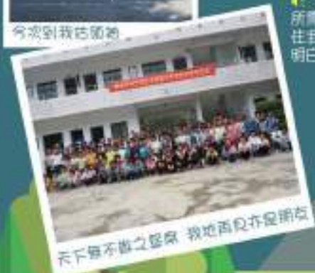
天下無不散之筵席 我地再見亦愛朋友