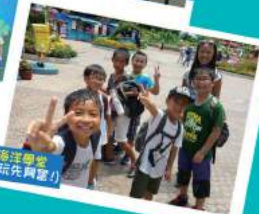
海洋學堂 (未玩先興奮！)