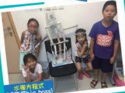
水彈方程式 (呢隻係big boss)