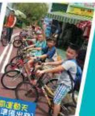
暑期運動天 (列隊準備出發)