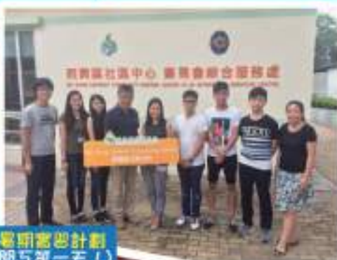
暑期營訓計劃 (開工第一天！)