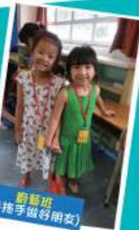
葡葡班 (手拖手做好朋友)