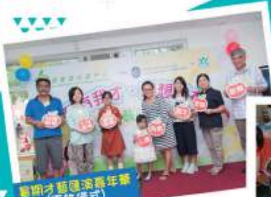
暑期才藝匯演嘉年華 (嘉許儀式)