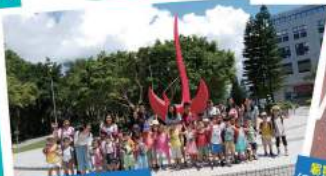
參觀科大 (用科大 landmark 打卡先)