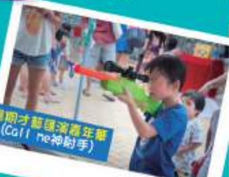
暑期才藝匯演嘉年華 (Call me 神射手)