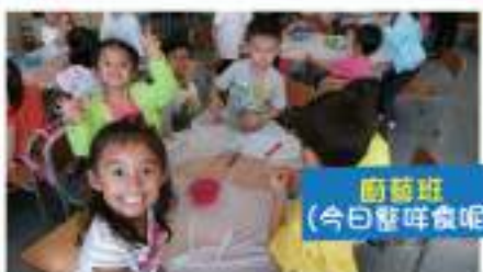
葡葡班 (今日整咩食呢)